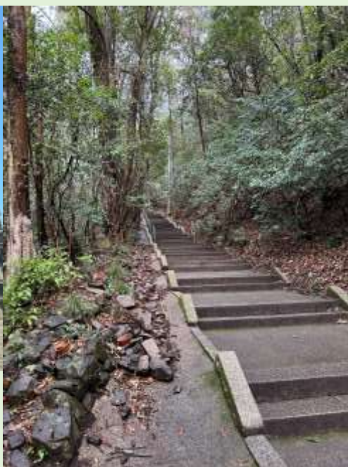
第7番札所谷峠の境内