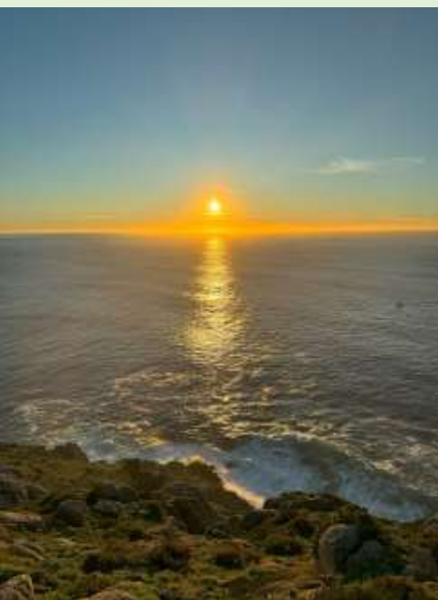
フィニステラの夕日

また、会場内では四国遍路に行かずとも同様の功德が得られるという「お砂踏み」を四国八十八ヶ所霊場会のご協力を得て、開催します。