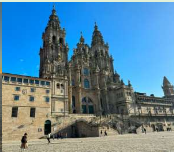
サンティアゴ・デ・コンポステーラ大聖堂